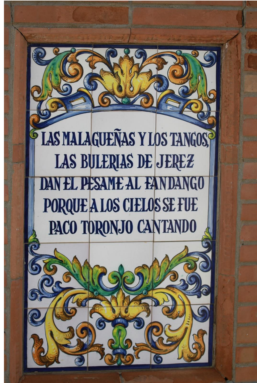
Trasera del pedestal