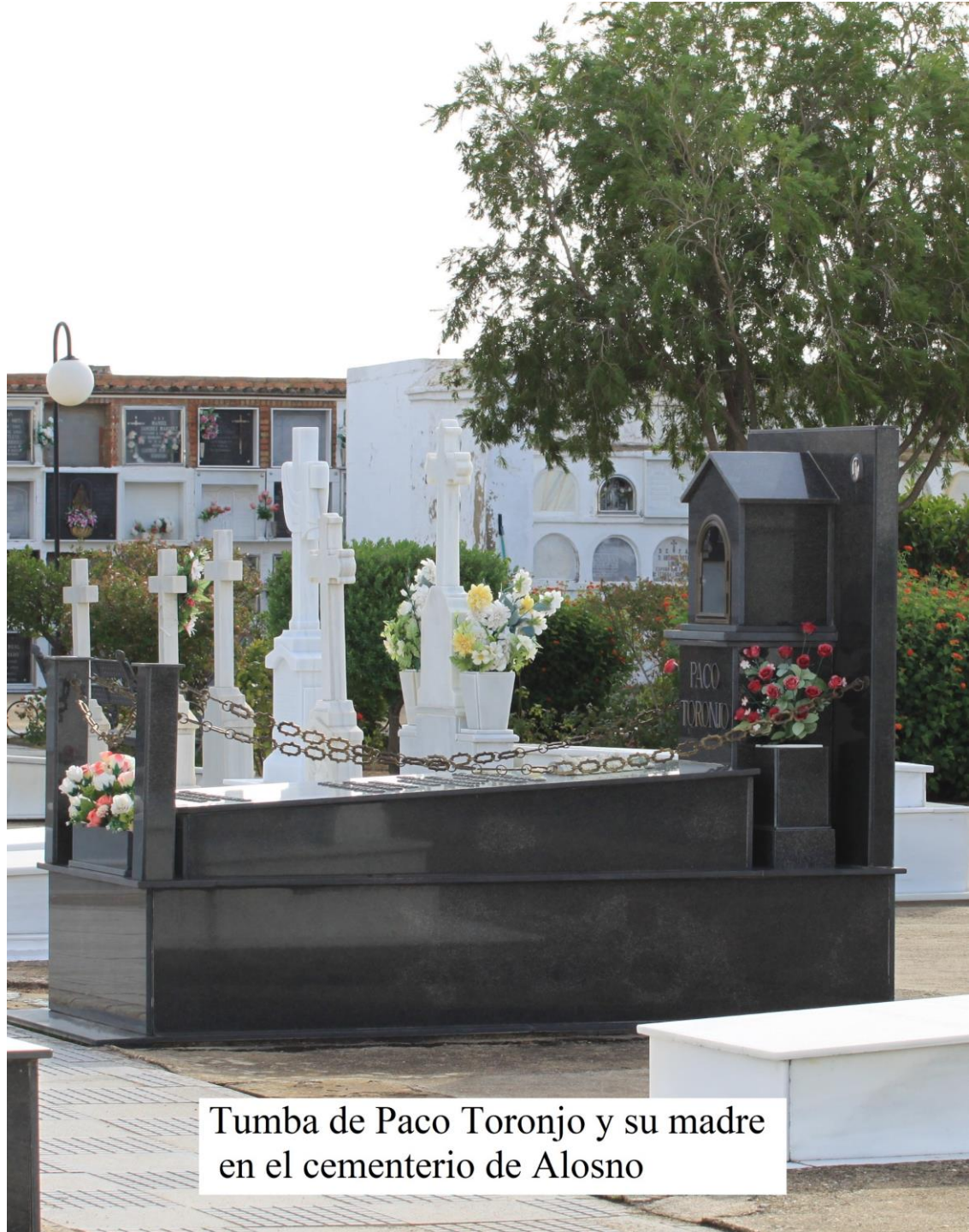
Tumba de Paco Toronjo y su madre en el cementerio de Alosno