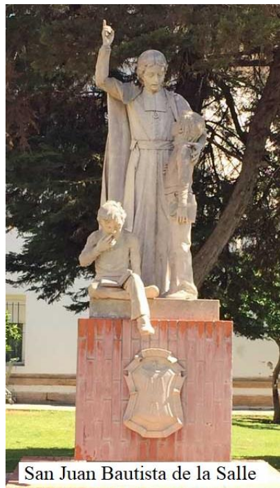
San Juan Bautista de la Salle

https://lasevillaquenovemos.com/2015c/salle.html