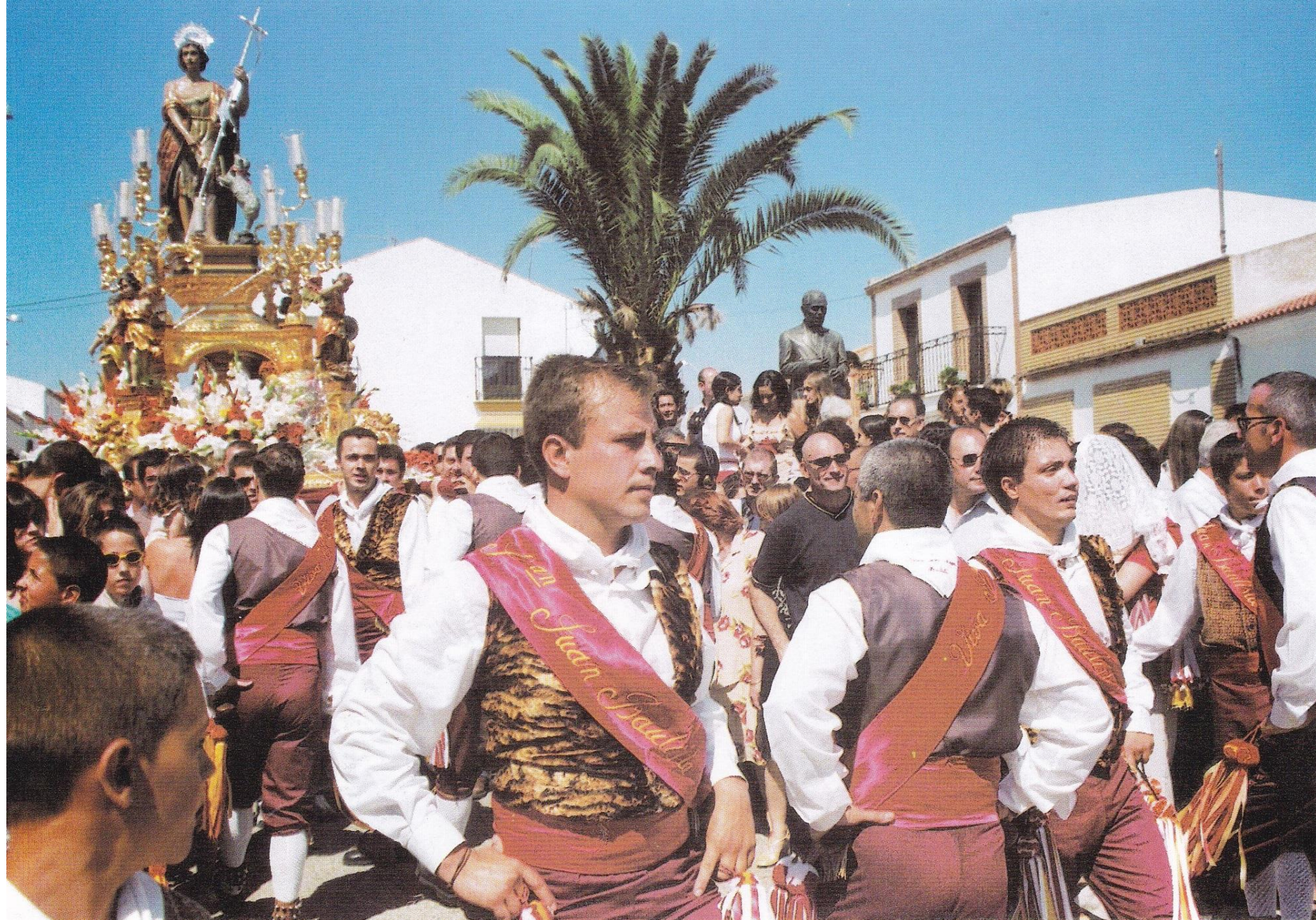
Galería de imágenes a través de los años, donde podremos observar la evolución del entorno. Año 2002