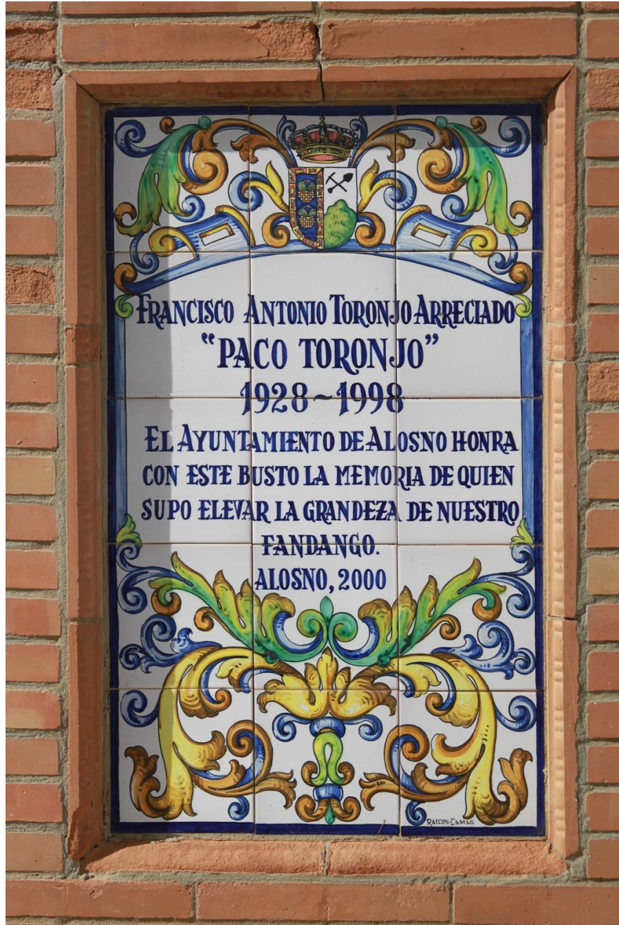
Frente del pedestal